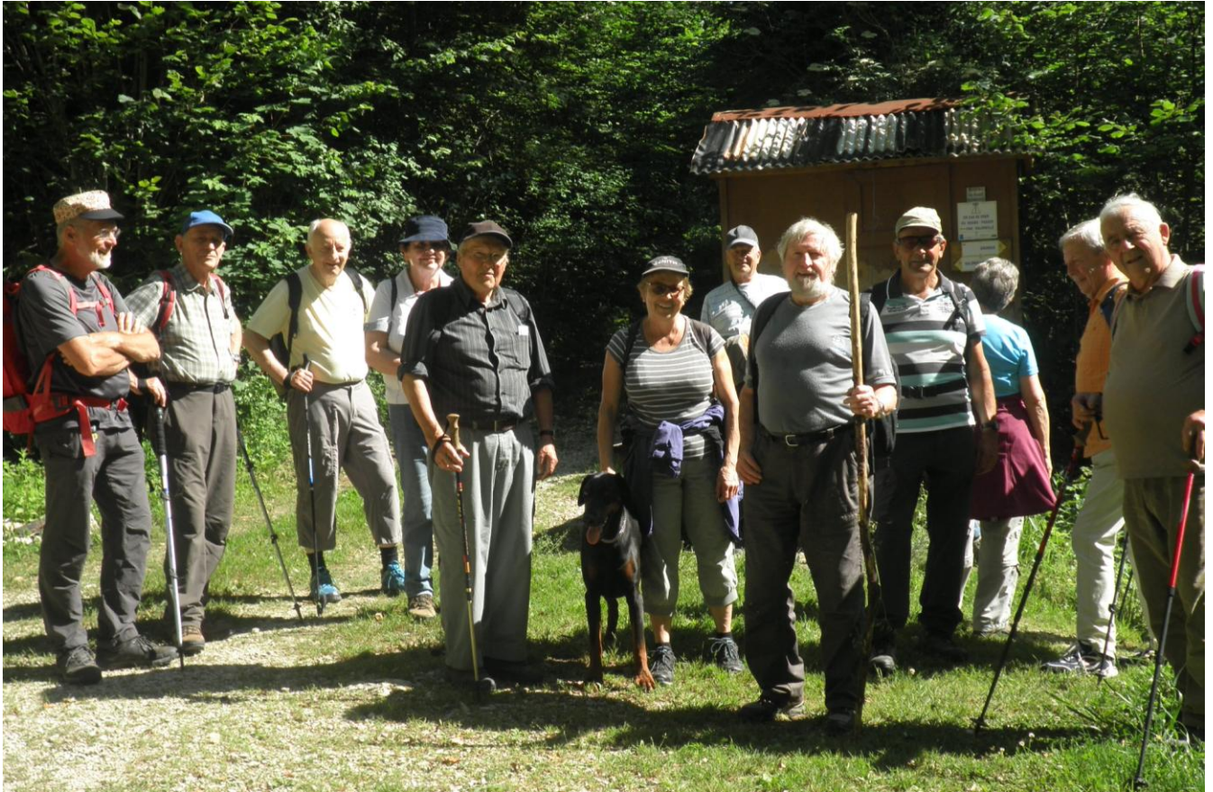
Compte-rendu suivra... peut-être