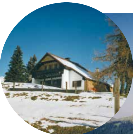
CHALET DES ILLARS 1440 m