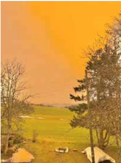
Mont de Buttes 6 fév. 2021