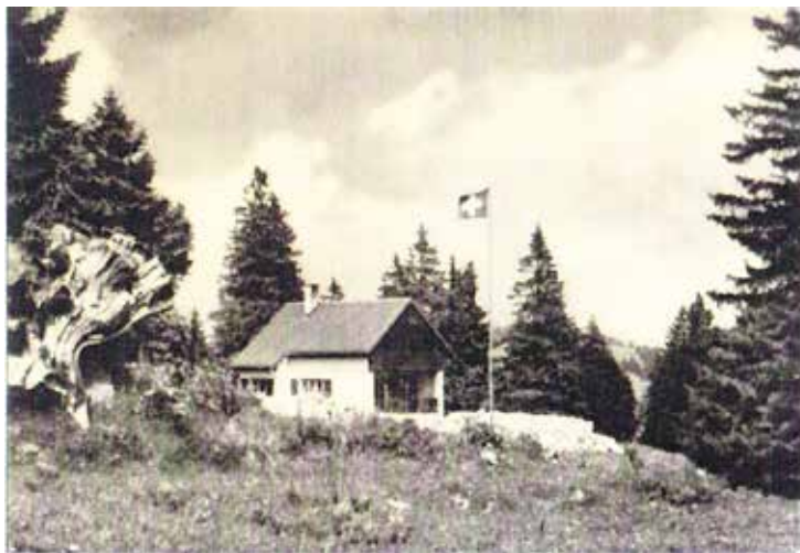
Le Mazot des Illars en 1937

Depuis de années les dames donnaient un coup de mains apprécié aux nettoyages, aux couvertures et aux lessives. Les cuisines sont affaires d'hommes. Ils s'y débrouillent mieux que bien.