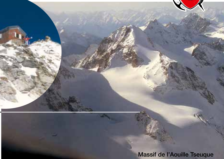
Massif de l'Aouille Tseuque