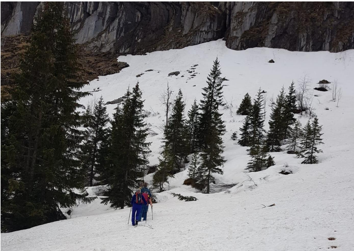
Trop de neige, trop pénible !