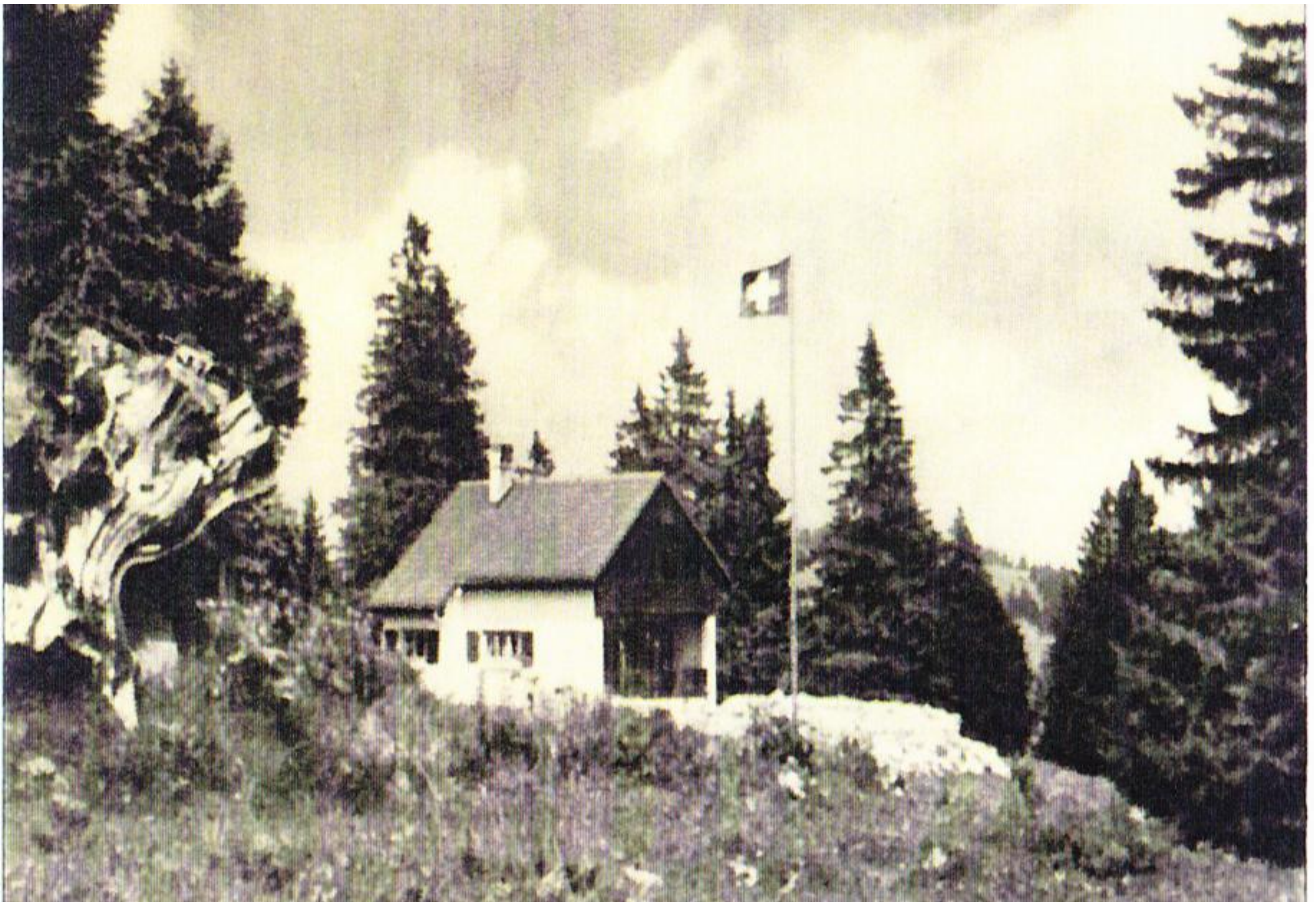
Le Mazot des Illars en 1937