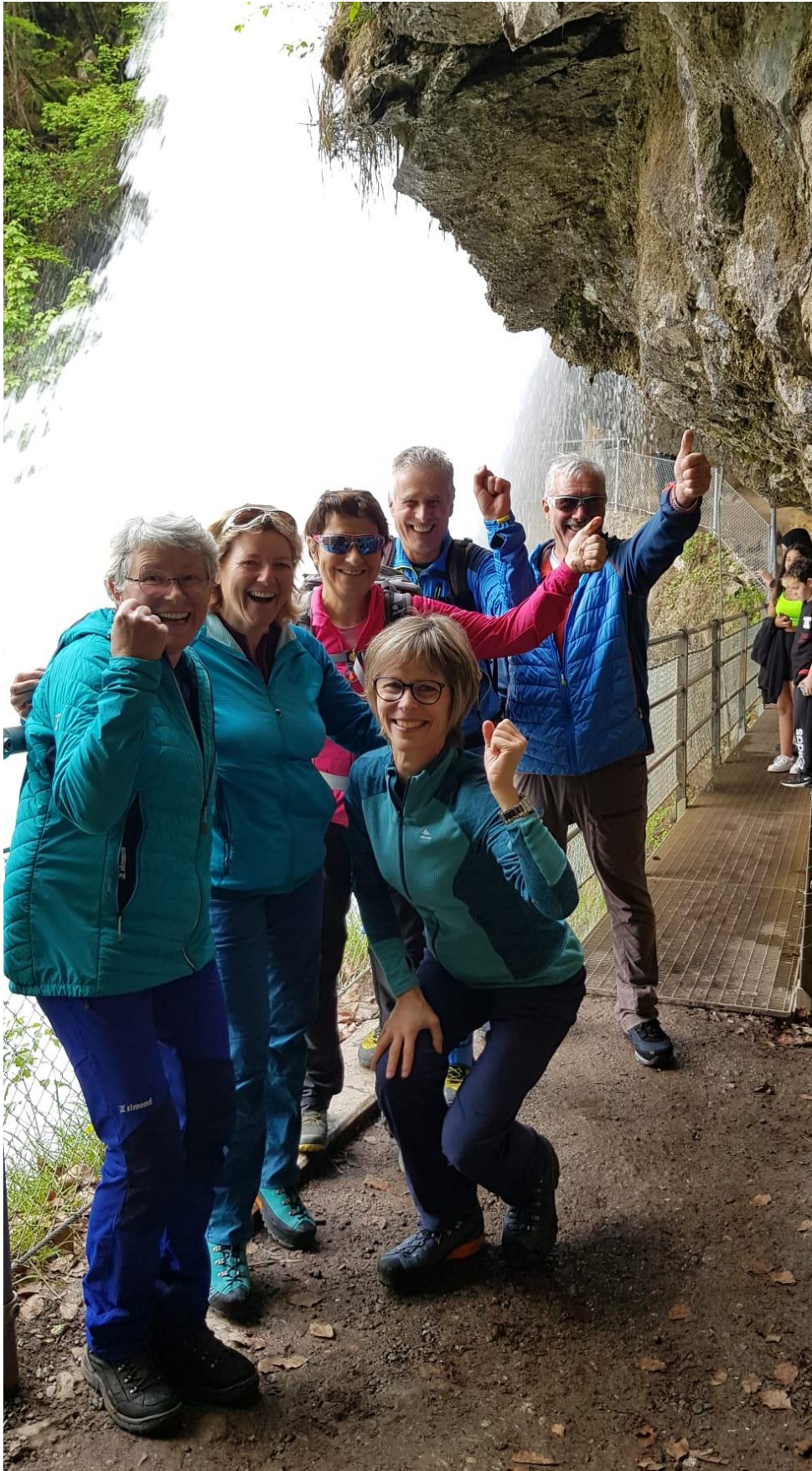
En arrière-plan les chutes de Giessbach