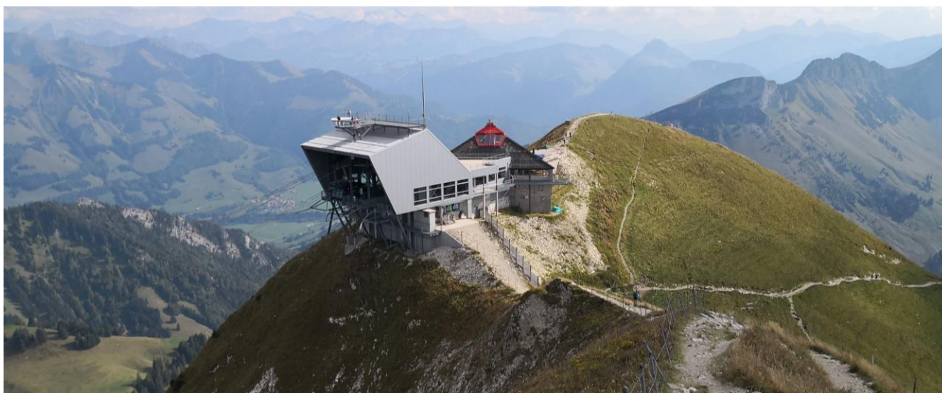
Le sommet du Moléson

Avec mes remerciements et au bonheur de vous retrouver pour cette journée de détente et d'amitié.