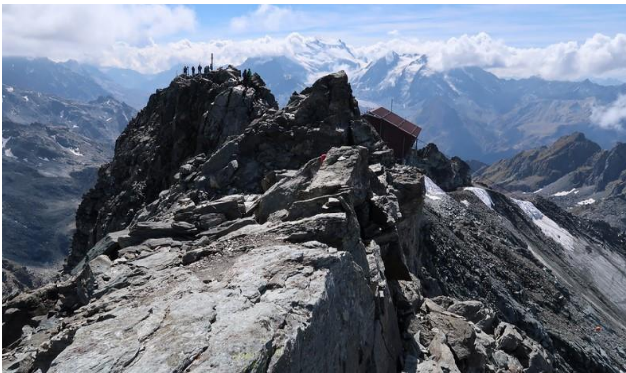
Le Mont Fort

Inscription : Blaise Huber avant le 9 juillet au 079 654 15 83