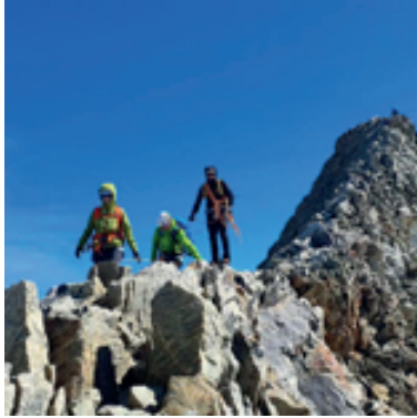
Emile- Laetitia- Elodie